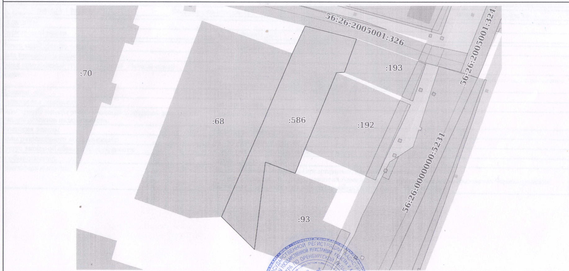
План (чертеж, схема) земельного участка