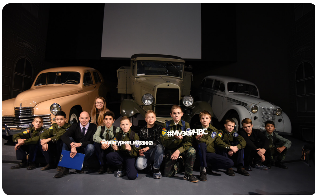
Авторы и участники проекта «От сельской МТС до гаража Премьер-министра»

Проект начал свою работу еще в октябре, в течение пяти месяцев проекта для ребят будет работать студия стендового моделирования, проведены мастер-классы, экскурсии на ООО СП «Колос» и автомобильные мастерские, выезды на экспериментальные посевные площадки, встречи