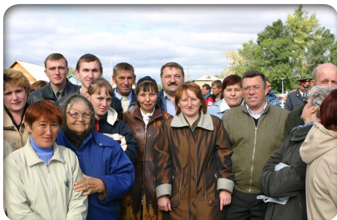
Сотрудники ООО «КХ «Колос», 2006 год