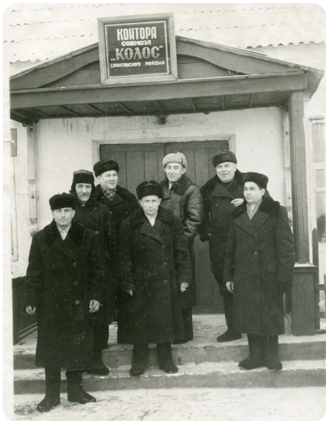
Первые работники совхоза «Колос», 1960-е годы

Как известно, машинно-тракторные станции владели всей техникой, имели централизованное снабжение, а с 1953 года обрели еще и статус территориального органа управления сельским хозяйством на местах: они вели агрономическое, ветеринарное обслуживание колхозов всей зоны, доводили до них производственные планы и принимали отчеты о работе. То есть это были крупные производственные предприятия, получавшие за свои услуги от колхозов пятую часть урожая зерновых.