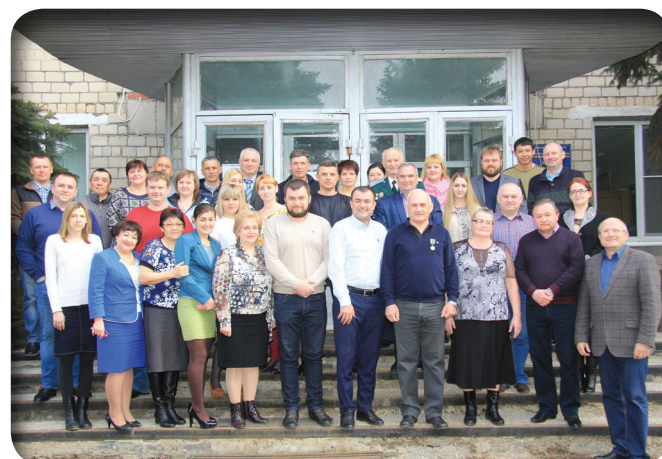
Коллектив ООО «СП «Колос»

Кроме всего, предприятие проводит работу по возрождению сел. Ежегодно выделяется спонсорская помощь около 1 миллиона рублей: детским учреждениям, детским лагерям, церковным приходам, на проведение праздников сел и деревень, поддерживаются ветераны войны и труда, работавшие ранее в хозяйствах. В счет заработной платы выделяется сельскохозяйственная продукция (мясо, зерно, сено, солома), оказываются услуги по вспашке огородов и приусадебных участков. В зимний период проводится очистка сельских дорог, по необходимости выделяется транспорт. Поддерживаются партнерские отношения с местными муниципальными органами на селе.