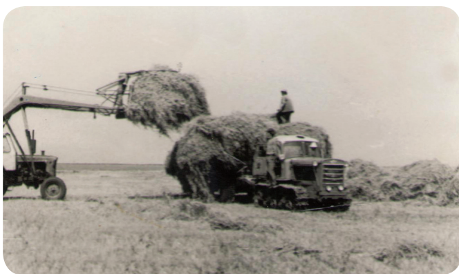
Заготовка сена, 1989 год