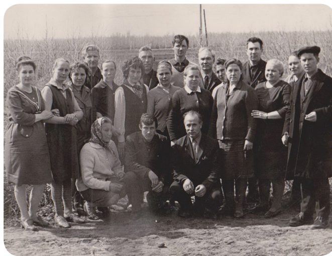
Специалисты совхоза «Колос»